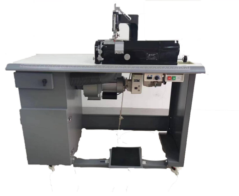
R-801S2-2 双送料型特殊圆刀削皮机